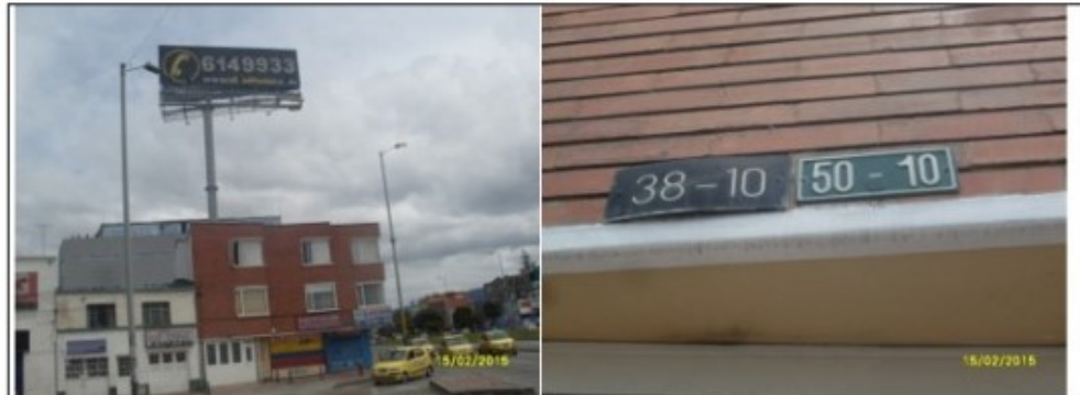
VISTA PANORÁMICA Y DE LA PUBLICIDAD CL 93 A NO 50 - 10 SENTIDO SUR-NORTI